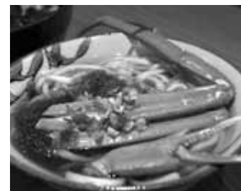
店内カウンターでは里山や里海の恵みが盛られたうどんも食べることができる。