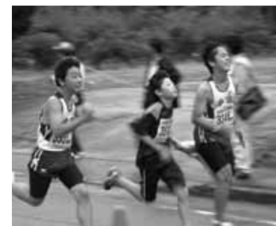
ゴール目指してラストスパート