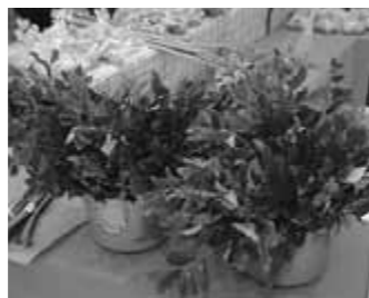
能登の里山に自生するサカキ。能登産のサカキは品質が良いとされ、商品価値が高い。