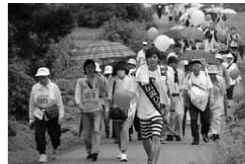
「猿鬼伝説ひろめ隊」となったぶんぶんボウルが歩こうの部5kmに参加