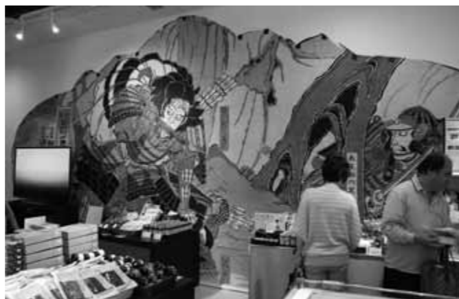
店内には、小木の袖キリコ祭りです実際に使用されていた武者絵が壁一面を飾る。