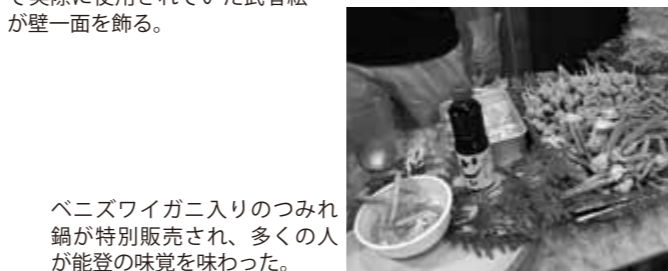
ペニズワイガニ入りのつみれ鍋が特別販売され、多くの人が能登の味覚を味わった。