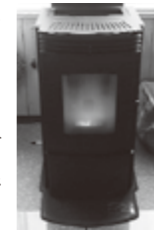
岩井戸公民館に設置されているペレットストーブ

町では、ペレットストーブを購入した人に費用の一部を助成しています。ペレットストーブの燃料となるペレットは今まで利用されていなかった木材を利用するため、環境に優しい燃料です。家庭でもできる環境保護を始めませんか。