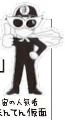
宇宙の人寝着 まいてん寝面