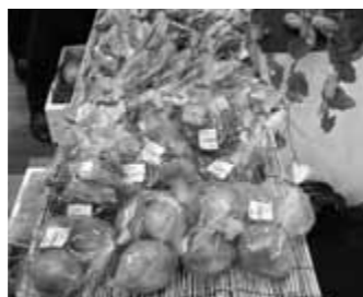
取れたての旬な野菜を販売。値段も手頃で多くの買い物客が手にとっていた。