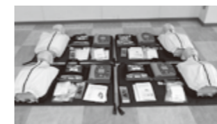
AED トレーナー、AED パッド、心肺蘇生人形