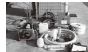
D-1 級軽可搬消防ポンプ一式

秋吉女性防火クラブの日ごろの地域防災活動が認められ、地域のコミュニティ活動の充実・強化を目的とする「宝くじの社会貢献広報事業」として、宝くじの助成金で整備されたものです。