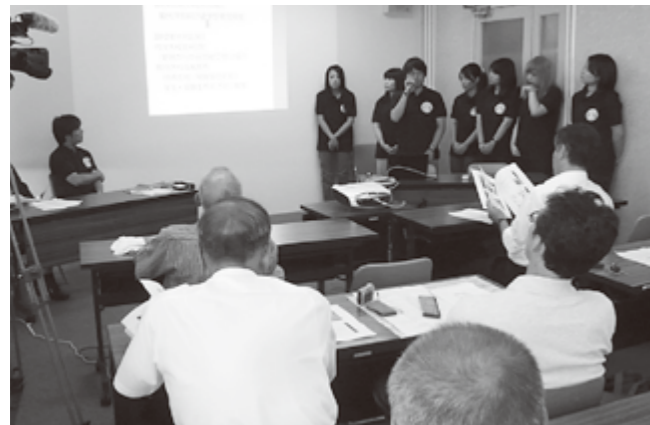
観光業者らに交流人口増加策を提案する大学生たち

最終日の8月9日のプレゼンテーションでは、参加した観光業関係者らに町の観光の魅力や問題点を提示し、観光素材を生かした都市住民との交流人口増加策の提案などを行いました。