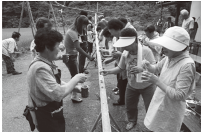
道路をまたいで流れてくる長さ80cmの流しそうめん