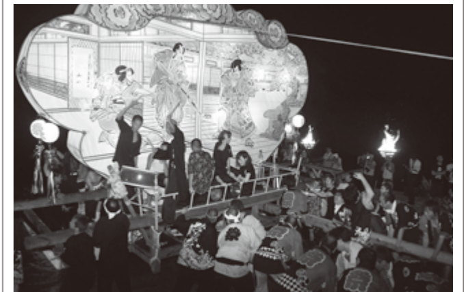
積棒(つんぼう)を使って、袖キリコを伝馬船に担ぎ上げる