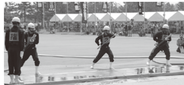
全国トップレベルの操法を披露した三波分団

石川県消防操法大会が7月28日、県消防学校で開催されました。能登町代表として出場した三波分団は惜しくも準優勝という結果でした。