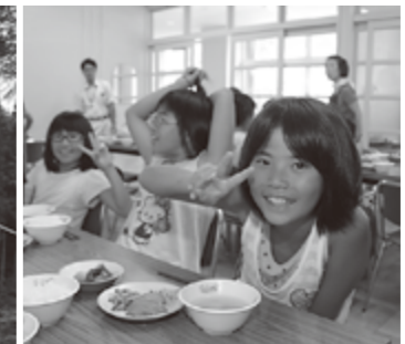
▲昼食も仲良くにぎやかに