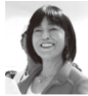
日本プロテニス協会理事長 佐藤直子さん