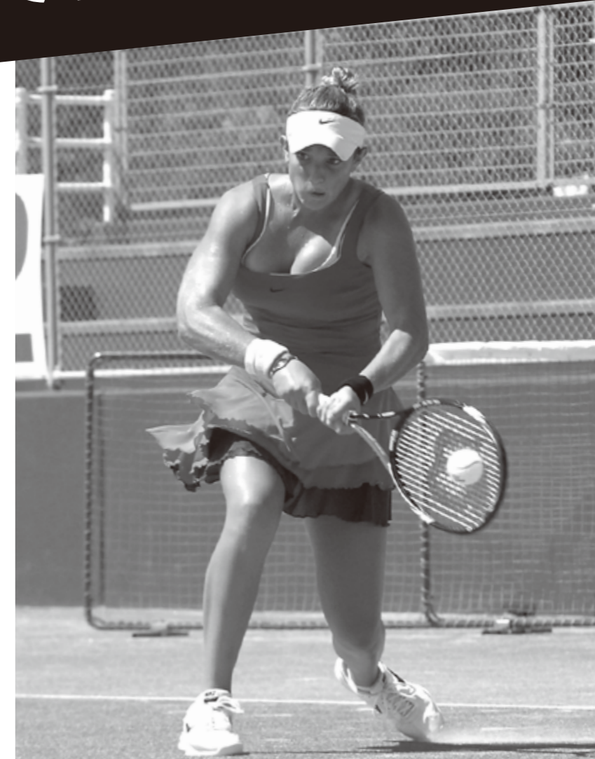
昨年のシングルス制したタマリン・ヘンドラー選手(ベルギー)

※観戦は無料です。 ※試合開始時間、予定試合は変更になる場合があります。 ※試合は山側のコートで行います。海側コートは練習用とイベント用に使用します。 ※1試合の試合時間は早い場合で約1時間、接戦の場合は3時間近くかかる場合もあります。