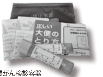
大腸がん検診容器