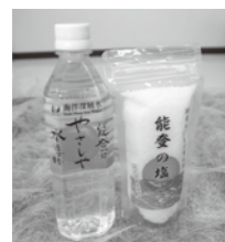
能登海洋深層水から生まれた飲料水 「能登はやさしや水までも」と 非直火式低温製法で作られる 「能登の塩」

☎0768-62-8532 FAX 0768-62-4506 E-mail: furusatoshinkou@town.noto.lg.jp