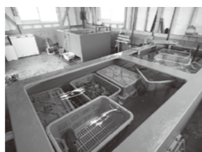
昨年10月、施設の敷地内に完成した蓄養施設。海洋深層水原水を掛け流しにした3トンのいけすと冷却加温ユニット付きの1トン槽が整備されました。