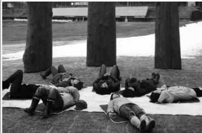
環状木柱列の中で古代からのパワーを感じる参加者

ツアーには、首都圏から合計17人が参加。真脇遺跡公園や姫海岸線でのノルディックウォーキング、市場・酒蔵見学、ふるさとの匠の語りなどを楽しみました。食事ではクジラやキノコ、郷土料理など、能登ならではの食を満喫していました。