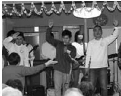
▲2月には小水サービスセンターを訪問し、お年寄りに喜ばれた

バンドは2004年に結成。毎年メンバーは入れ替わり、船の準備が始まる前の1〜3月に奥能登地方を中心に学校や福祉施設などで演奏しています。バンド名はインドネシア語でイカを意味する「チュミ・チュミ」に由来しています。