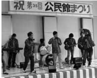
▲演奏会ではインドネシアの伝統的なバティック柄ジャケットを着ることが多い

石川県漁業協同組合小水支所では、イカ釣り漁を応援し、研修期間が3年間で、6〜12月