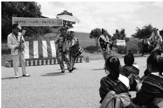
派手な衣装と音楽で会場を盛り上げたちんどんショー

過去2回は雨に見舞われたこのイベント。今年は晴天に恵まれ、たくさんの方がブルーベリー摘み取り体験やステージイベントを楽しみました。植物公園駐車場に設けられた特設ステージでは、能登町太鼓連響による太鼓演奏のほか、こどもみらいセンターやっちゃ連のよさこい、ちんどんショーなどが披露されました。