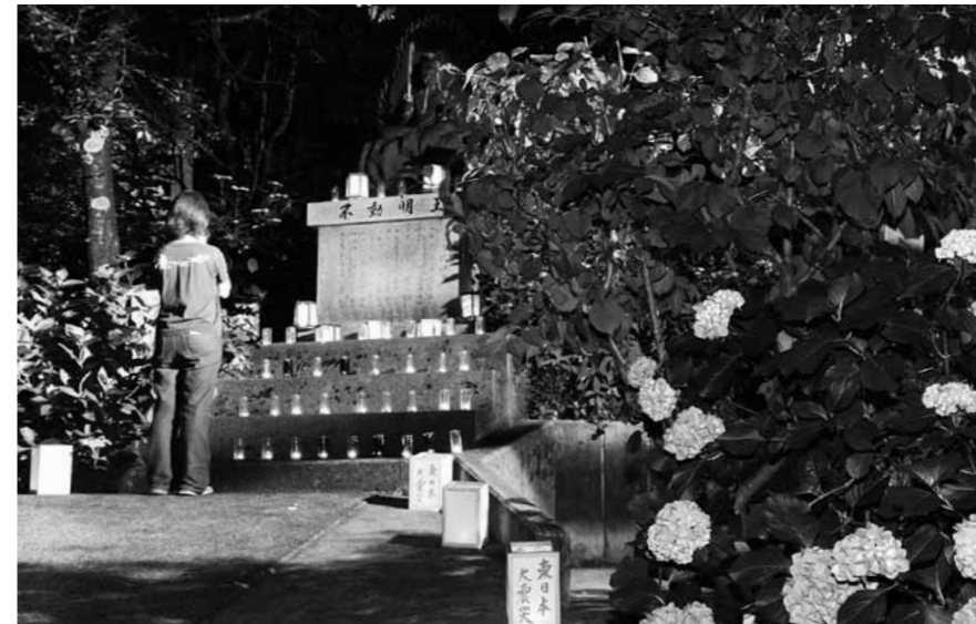
◀灯ろうやガラスコップの灯りで幻想的に照らされる十三仏とアジサイ