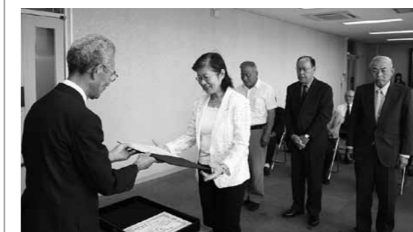
7月12日に桶屋選挙管理委員会委員長から当選証書が交付