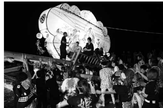
2本の積棒(つんぼう)を使い、力を合わせて伝馬船に担ぎ上げる

午後11時ごろまで湾内をゆっくりと周回した袖キリコは、1基ずつ船から降ろされます。集まった見物人は、袖キリコを担ぎ上げる迫力と、海面に浮かび上がる幻想的に雰囲気魅了されていました。