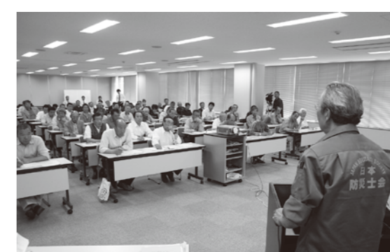
自主防災組織アドバイザーの話を真剣に聞く参加者。県では自主防災組織設立を検討する団体へのアドバイザーの派遣(無料)も実施している。

地域の防災力を高めるためには①自分の命は自分で守る「自助」②地域や近隣の人が互いに協力しあう「共助」③行政や消防機関による救助救援の「公助」の3つが重要です。