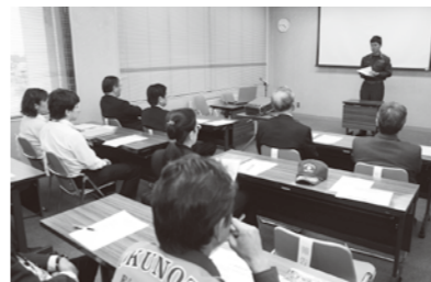
「能登も同じような地形であり、今まで以上に防災に力を入れなければならない」と報告する消防職員

報告を受けた持木町長は、職員に感謝するとともに「今後も継続して支援していくことが重要であり、協力をお願いしたい」と呼びかけました。