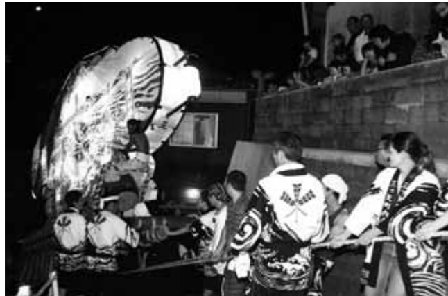
神社に続く階段を引き揚げられる袖キリコ

神社に続く急な階段を巨大な袖キリコが登る、祭りのクライマックスは午後11時ごろから。たくさんの観客が見守る中1基ずつ階段に入り、はやしに合わせて引き揚げられます。登り切るまでは気を抜くことができない危険を伴う運行。無事に登り終えると、拍手がわき起こっていました。