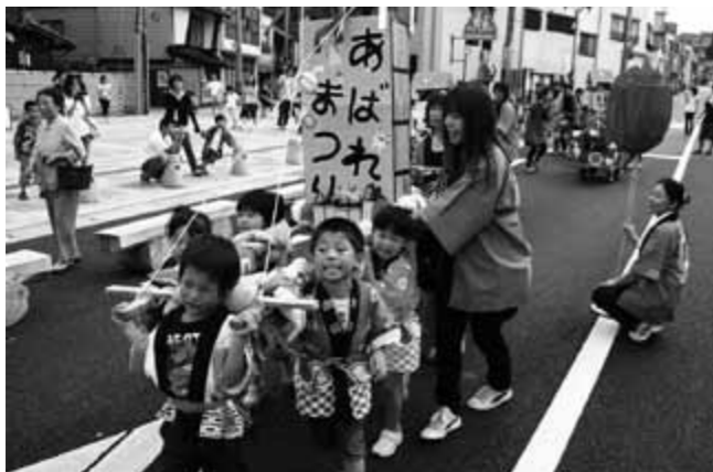
元気いっぱいキリコを担ぐ保育所園児

宇出津商店街通りの恒例行事、歩行者天国「のど地物市まつり」は、9月19日に開催されました。午後3時、地元保育所園児によるキリコ祭りで幕を開けた歩行者天国。会場では宇出津小学校の鼓笛隊やバンド演奏などが披露され、商店街を訪れたたくさんの観客を魅了していました。商店街通りでは模擬店や地物市が店を並べ、新鮮な野菜や特産品、地ビールなどを買い求める人でにぎわいました。灯りフェスティバルが始まった夕方からは、高校生によるダンスや和太鼓、カラオケ大会などが催され、商店街は最後まで活気を見せていました。