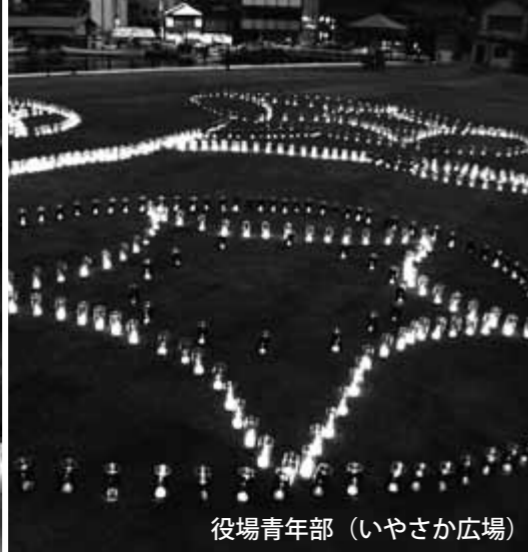
役場青年部（いやさか広場）