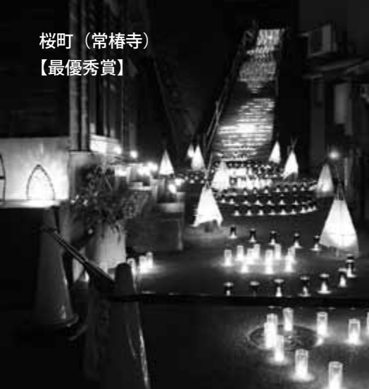
桜町（常椿寺） 【最優秀賞】