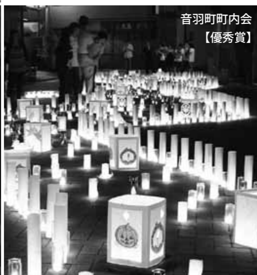
音羽町町内会 【優秀賞】