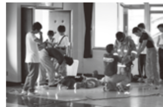
能登消防署 (火災：要救助者救出訓練)

7月28日から30日の3日間、能登町内の中学2年生10人が「わく・ワーク体験」（職場体験学習）で、能登消防署や内浦分署において消防士の心得、水利調査や放水訓練、救助訓練などを体験しました。