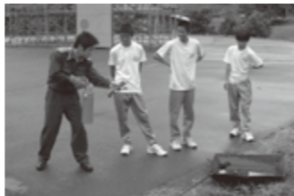
内浦分署 (消火器取り扱い訓練)