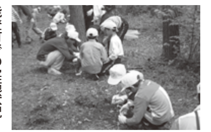
能登町での実施状況 【計画面積】1508ha 【これまでの実施面積】894ha ※計画期間平成19～23年度

強度間伐を行うと、下草や低木が生えて水源のかん養や山地災害の防止などの公益的機能が向上します。これらの機能の回復状況や鳥類などの生息状況も検証しています。