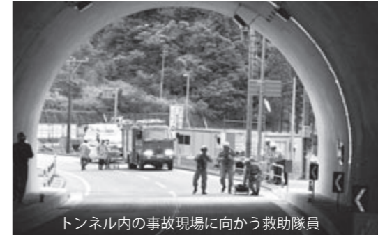
トンネル内の事故現場に向かう救助隊員

北 河内ダムの付替県道と五十里地区と北河内地区を結ぶ北河内トンネル内で、9月6日に交通事故を想定した訓練が実施されました。訓練には、道路を管理する県営能登土木総合事務所や、県北河内ダム建設事務所、能登警察署、能登消防署柳田分署などの関係者合わせて40人が参加しました。