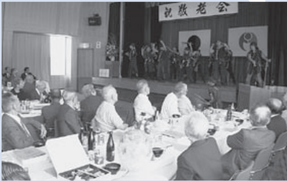
宇出津敬老会での「やっちゃ連」