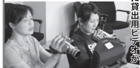
カメラの使い方を確認する公民館職員のみなさん

宝くじ助成金で公民館に貸出用ビデオが 配備されました このたび、能都地区と内浦地区の公民館に貸出用ビデオカメラが配備されました。このビデオカメラは、地域のみなさんに撮影していただいた映像を能登町有線テレビで放送することを目的に、(財)自治総合センターの宝くじ助成金の助成を受けて整備されました。 地域の行事や出来事を有線テレビで放送してみませんか？詳しくは最寄りの公民館にお問い合わせください。 ※ 個人的な理由ではお貸しできません。 ※ 柳田地区の公民館にはすでに貸出用ビデオカメラが配備されています。