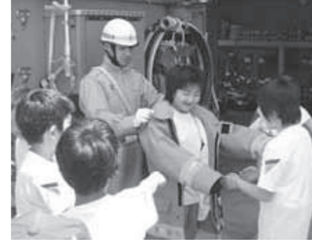
▶防火衣を身にまとい気分は消防士

6月2日、松波小学校4年生23人が、社会科見学の一環として能登消防署内浦分署を訪れました。児童たちは、職員から消防の仕事について説明を受けたあと、庁舎や通信室、そして消防車両を間近で見たり、消防用資機材に触れてみたりと積極的に見学していました。