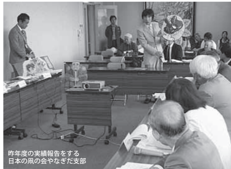
昨年度の実績報告をする日本の風の会やなぎだ支部

審査会の一部は公開されており、ファンド運営委員による審査の結果、今年度は7団体すべてを対象に総額で778万円を助成することに決まりました。助成団体の構成や内容などは次のとおりで、制度が始まった平成8年度からの助成金累計額は3,000万円を超えました。