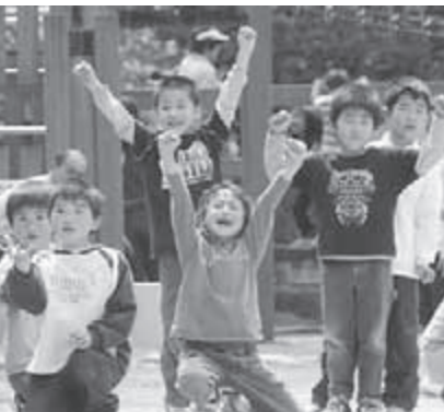
5月5日に遠島山公園で開催された親子レクリエーションでのひとコマ