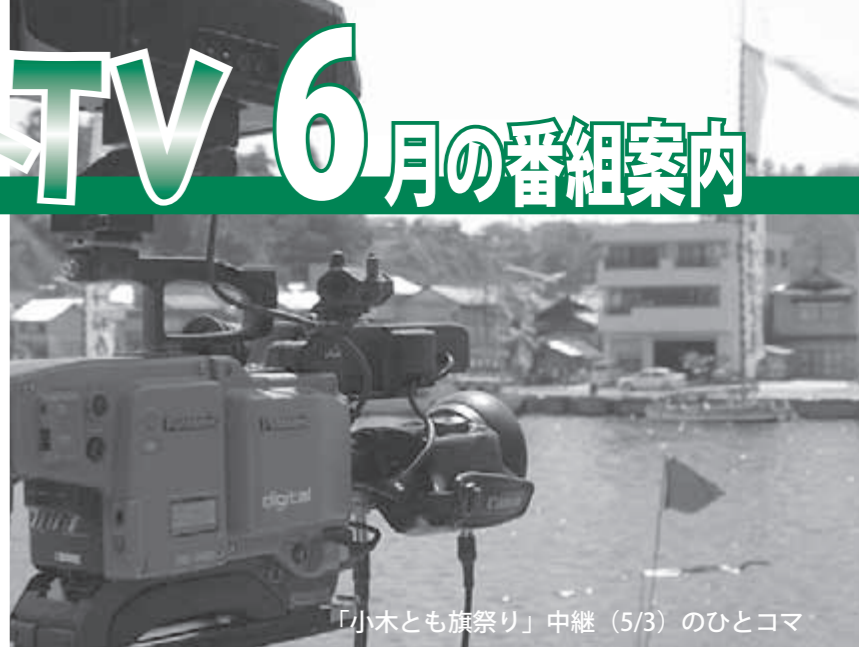
「小木とも旗祭り」中継(5/3)のひとコマ