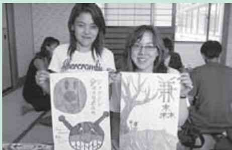
日本の家族に逢いたい!