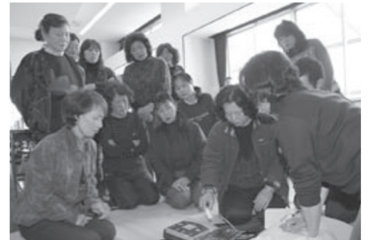
AEDの取り扱いを体験する女性防火クラブの皆さん

2月24日、能登町消防防災総合センターで、第3回女性防火の集いが開催され、町内の女性防火クラブから約50人が集まりました。