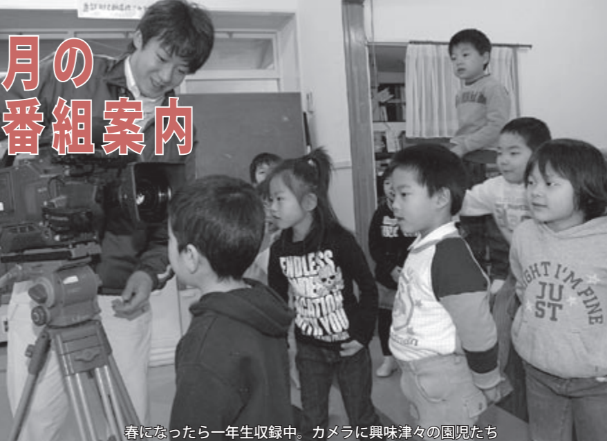
春になったら一年生収録中。カメラに興味津々の園児たち