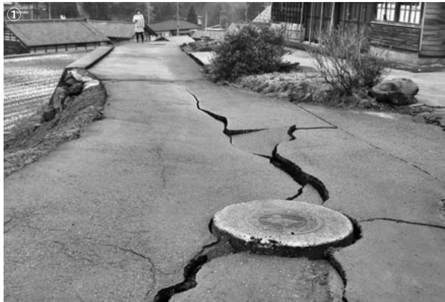
①黒川市内の町道、マンホール周りのアスファルトがひび割れた。

知っておきたい地震豆知識① ●マグニチュード(M) 地震の規模を示す単位。M7以上：大地震、M5～7：中地震、M3～5：小地震、M1～3：微小地震、M1未満：極微小地震、数値が1増えるとエネルギーは32倍になる。(2増えると1000倍) ●震度 ある地点における地震の揺れの大きさを示す指標。全国に配置された計測震度計により測定され、発表されている。震度階級は0～7(5と6は強と弱)の10段階。 ●ガル(GaI) 地震動の強さを加速度で表す単位。