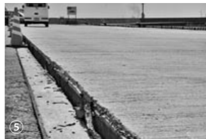
⑤小木新港では岸壁横の埋立地が長さ100mにわたり陥没するなど港の被害も大きかった。

現在の耐震基準は、宮城県沖地震から3年後の昭和56年に制定されました。柱と土台は筋交を金具で固定することなどが義務づけられ、かなりしっかりした内容となっています。これから家を建てる人は、地盤に注意すべきだと思います。昔は池や川だった土地や埋め立てた土地では、地盤が弱い可能性があり、新しく頑固な家でも地震が来れば家が傾くおそれがあります。で、地盤改良を必要とします。今すぐできる地震対策としては、家具の転倒防止をすることや家の定期的な手入れを欠かさないことなど、また今回の体験をきっかけに耐震診断を受け、必要な補強工事を行うことも大切だと思います。