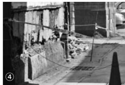
④今回の地震で全壊や半壊した家屋は、古い土蔵や納屋が多かった。