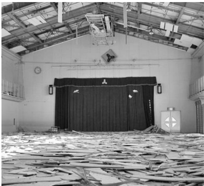
天井が崩落した体育館。前日に閉校記念式典が行われたことが信じられない