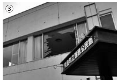
③瑞穂公民館、2階の窓ガラスが割れ、破片が周囲に飛び散った。