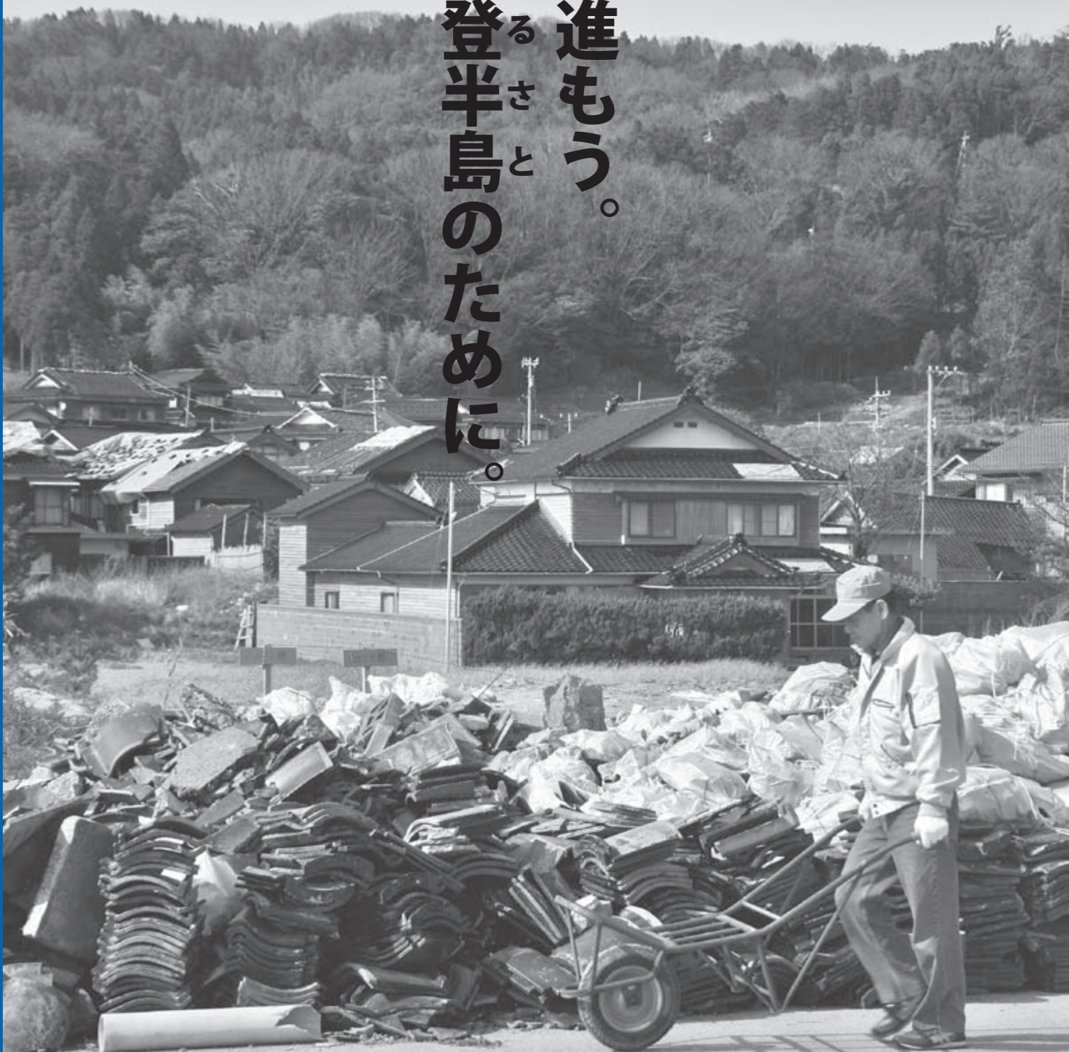
平成19年4月6日、復興が進む輪島市門前町にて