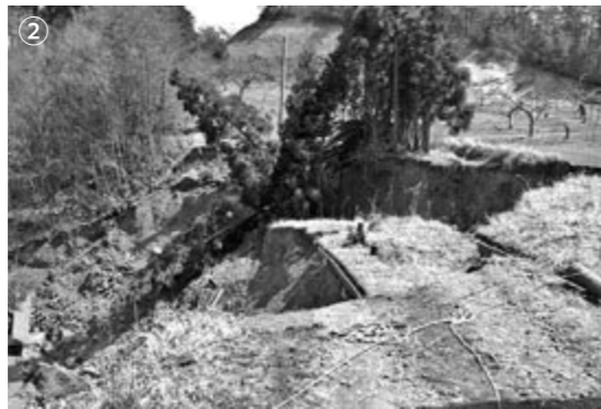
②国重地内の農道、約50mにわたり道路が陥没した。