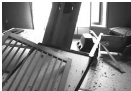
別館3階にある客室の地震直後の様子

もしも油に火が入っていたらどうなっていたのか。「他の施設の話を見ると、油が飛び散り、近づけないのですぐに火を消すことができなかった」ということだ。 厨房の被害はほとんどなかったという酒師さんが、今回の地震で学んだことは何だろうか。「実際の災害時は、多少なりともパニック状態になり何をすればよいのかわからなくなる。