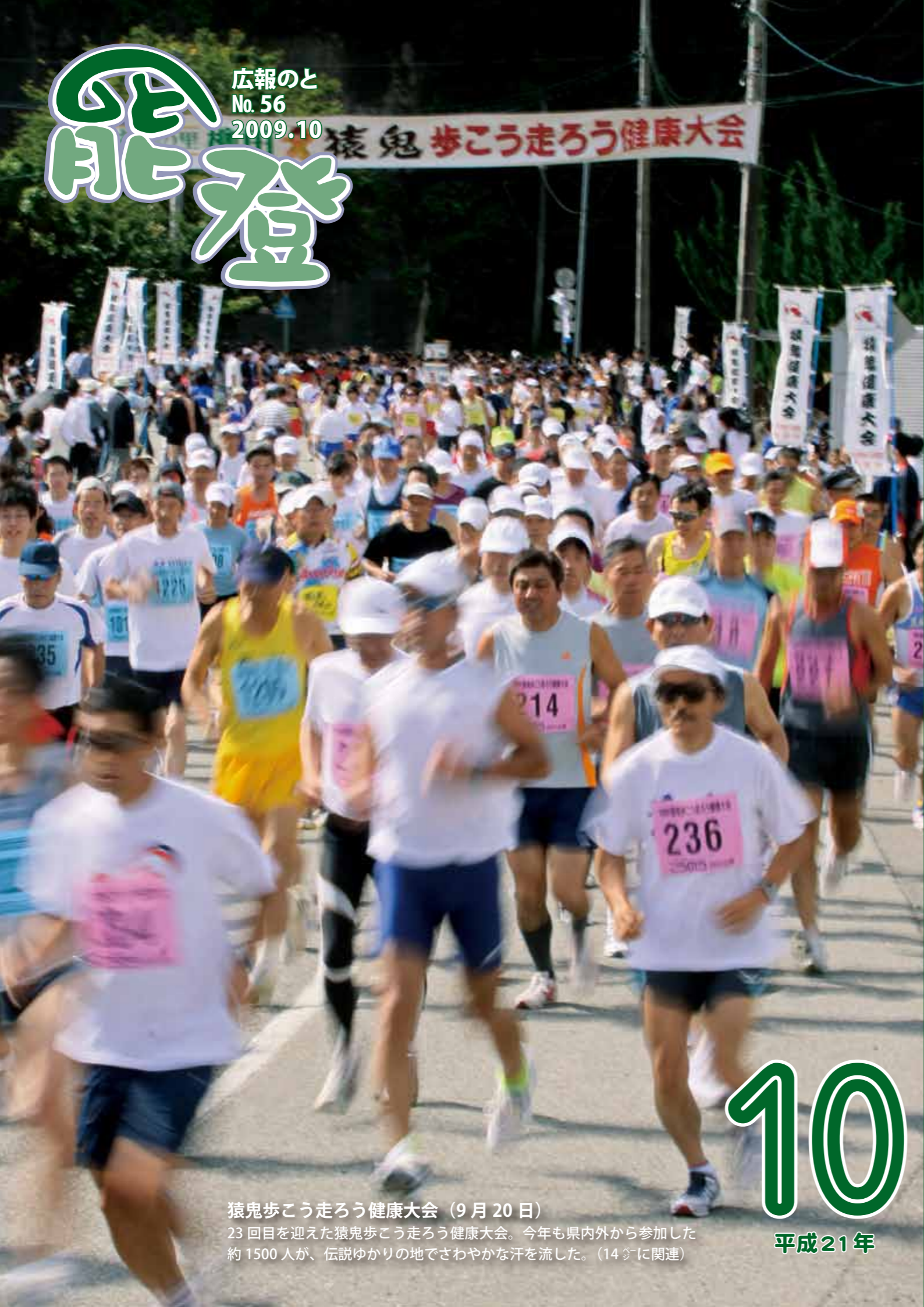
猿鬼歩こう走ろう健康大会 (9月20日) 23回目を迎えた猿鬼歩こう走ろう健康大会。今年も県内外から参加した約1500人が、伝説ゆかりの地でさわやかな汗を流した。(14頁に関連)