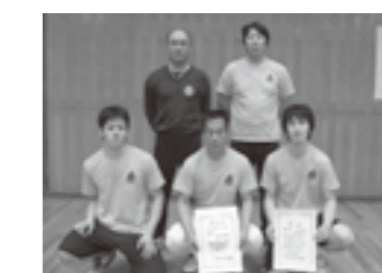
優勝の高倉消防団